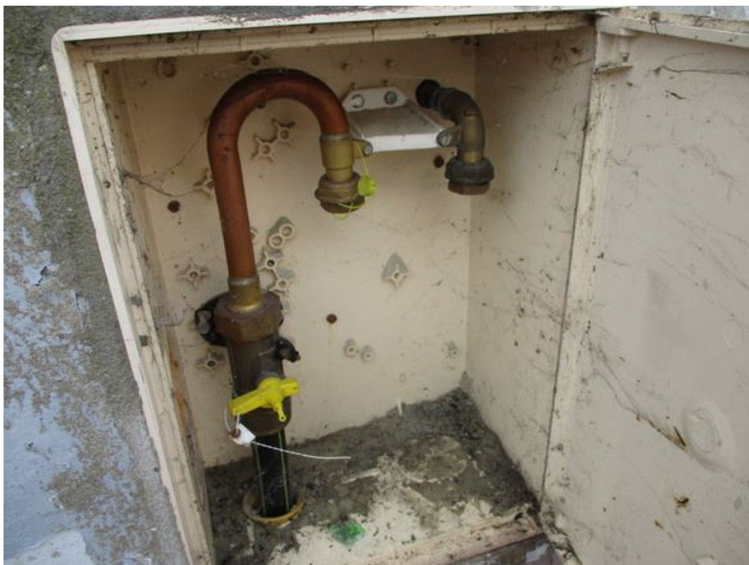
Absence de compteur gaz