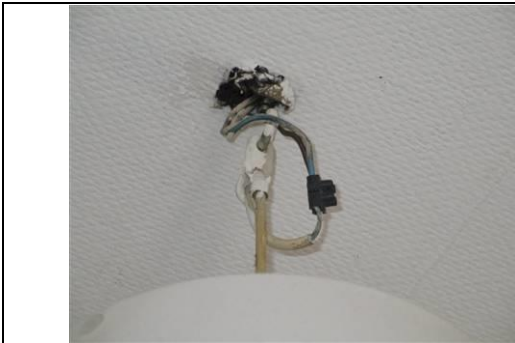
Photo Ele001 Libellé de l'anomalie : B7.3 d L'installation électrique comporte au moins une connexion avec une partie active nue sous tension accessible.