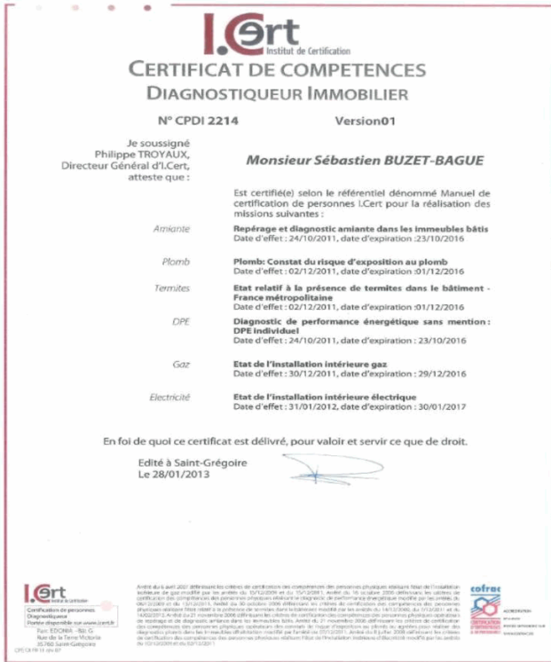
Parc Edonia Bat G rue de la Terre Victoria 35760 ST GR